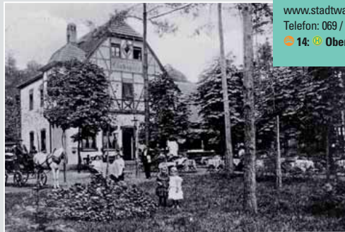
Waldrestaurant Forsthaus Gehspitz um 1910 und Frankfurter Stadtwald um 1850.