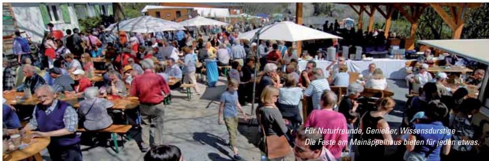
Für Naturfreunde, Genießer, Wissensdurstige – Die Feste am MainÄppelHaus bieten für jeden etwas.

pen Gelegenheit, Natur und Umwelt kennen- und als schutzwürdigen Raum schätzen zu lernen. Der „Hofladen“ bietet selbst angebaute Früchte und viele andere Produkte rund um Apfel und Obstgarten an. Auch das „Äppel-Bistro“ lockt mit regionalen Spezialitäten.