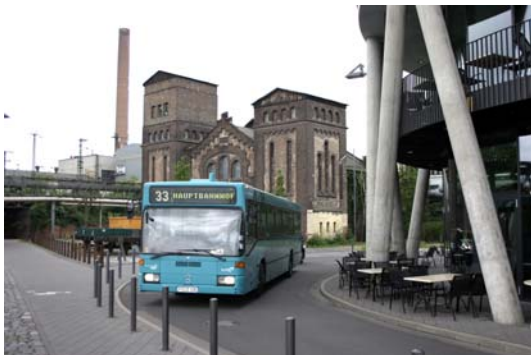
Vor wenigen Jahren neu eingerichtet wurde die Linie 33, die das Westhafenviertel mit dem Hauptbahnhof verbindet.

Das bereits mit der ersten Ausschreibung eingeführte Qualitätsmanagement dehnt traffiQ nun auch auf das vierte Linienbündel aus. Es basiert auf einer systematischen Überprüfung der Qualität des Busverkehrs anhand objektiver und subjektiver Kriterien. Dabei spielen die subjektiven, durch Fahrgastbefragungen ermittelten Aspekte eine besonders starke Rolle. Unterschreitet das