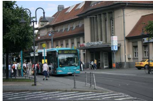
Stadion und Flughafen erschließt die 61 vom Südbahnhof aus.

Gleichzeitig mit der Ausschreibung hat traffiQ alle Linien im Bündel C überprüft. Das Ergebnis sind Verbesserungen auf vielen Linien, die ab Dezember 2008 verwirklicht werden: