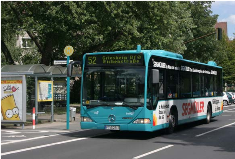
Der Feinerschließung der Stadtteile rechts und links der Mainzer Landstraße dient die Linie 52.

dort genutzte Privatstraße durch parkende Fahrzeuge für den Busverkehr ungeeignet. Die Linie wird daher über Goldstein nach Schwanheim geführt. Damit kommt traffiQ zugleich den Wünschen aus dem Stadtteil entgegen, die eine direkte Verbindung zur S-Bahn-Station Niederrad wünschten.