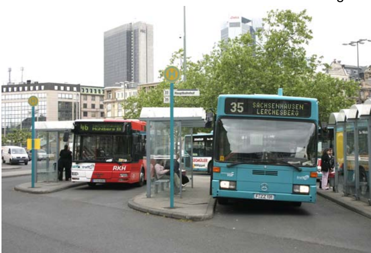
Am Hauptbahnhof beginnt die Linie 35 zum Lerchesberg

Selbstverständlich sind inzwischen auch die weiteren technischen Standards wie Niederflrigkeit, Klimaanlage, besondere Berücksichtigung der Bedürfnisse mobilitätseingeschränkter